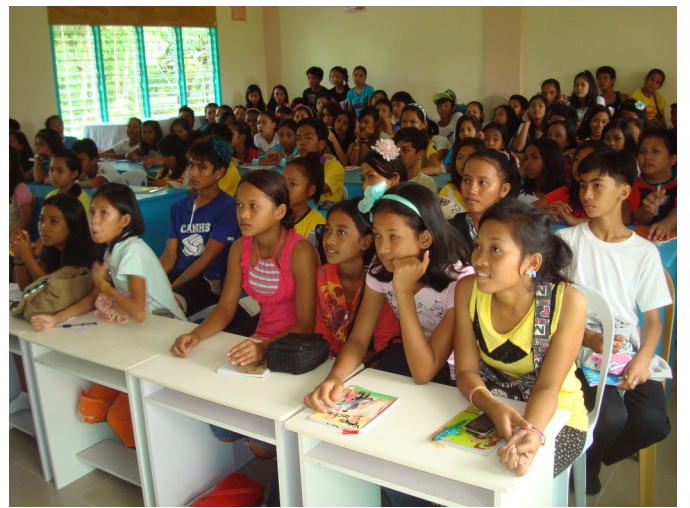
3차 토요 학교 개학 첫 날 (마띠 고등학교)

이전보다 많은 학생들이 등록 할 것이라 예상은 했지만, 토요 학교 첫날에 저희가 감당할 수 인원을 훨씬 초과한 112명의 학생이 참석을 했습니다. 안타깝게도 첫날부터 학교 내에 모든 인원이 함께 있을 만한 교실이 없어서 많은 혼잡함이 있었습니다. 마띠 고등학교 전교생의 약 ¼이 등록을 한 것입니다. 또한 어떻게 알고 왔는지, 11명의 타 고등학교 학생과 2명의 성인이 포함되어 있습니다.