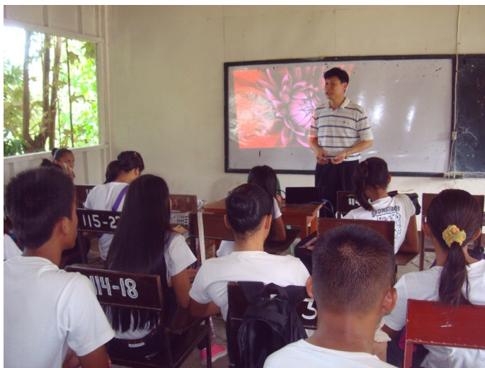
대학생 제자 훈련

또한 음악과 춤에 재능이 특출했던 3명은 대학 합창/무용단에 지원을 해서 두각을 나타내고 있고, 2명은 파트타임 일자리를 얻어서 용돈을 벌고 있고, 그리고 한 녀석은 벌써 같은 학과에 있는 여학생을 사귀기 시작했다고 합니다. 마치 소낙비를 풍성하게 먹은 싱그러운 나무들처럼, 학생들의 얼굴이 얼마나 밝아 졌는지 모릅니다. 참으로 감사할 뿐입니다.