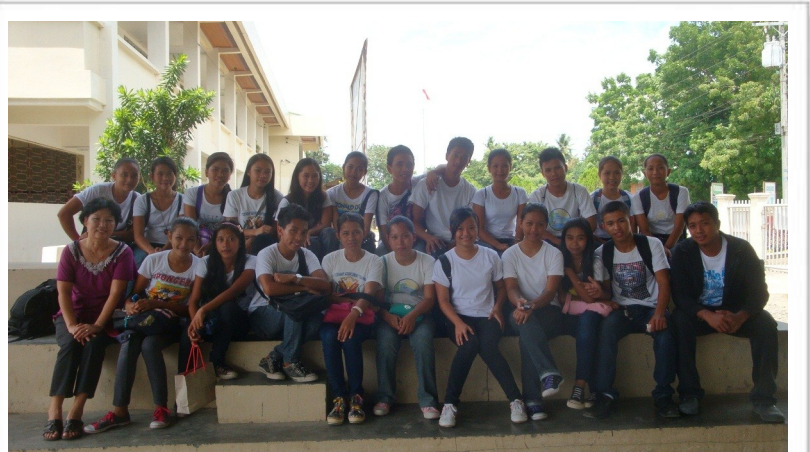
장학생들과 함께 (스파마스트 대학교)

Thank You 한국과 미국 방문을 마치고 스파마스트 대학(SPAMAST College)에 장학생으로 진학한 학생들을 만나기 위하여 설레이는 마음으로 오랜만에 대학교를 방문했습니다. 거의 한달 동안 선교지를 떠나 있으면서 몸은 바빴지만, 사실 머릿 속은 온통 대학 생활을 새롭게 시작하는 학생들에 대한 생각으로 가득했었습니다. 마치 시골 학생이 도시에 처음 올라 와서 당황하는 모습처럼, 대학이라는 새로운 환경에서 허둥지둥하는 학생들의 모습이 눈에 선했기 때문입니다. 혹시 두려움에 질려서 벌써 낙오한 학생은 없는지..... 그런데 막상 학생들을 만나고 보니, 그동안의 염려가 너무도 허탈할 정도로 학생들이 대학에 잘 적응하고 있음을 발견했습니다. 학점에 대한 의욕도 충만해서, 토요일에 개설하는 특별 과목에도 장학생 전원이 지원하여 열심히 따라 가려는 모습이 너무도 보기 좋았습니다.