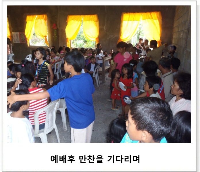
예배후 만찬을 기다리며

감사 주일을 지나면서 비록 연약한 교회 이지만 강한 팔로 불들어 주시는 우리 하나님의 은혜와 축복을 다시 한번 깊이 체험하며, 주님께 모든 찬양을 올려 드립니다. 할렐루야!