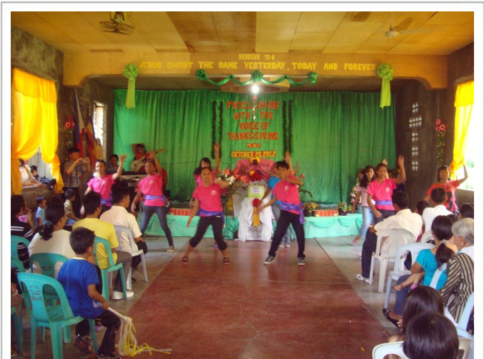
마띠 고등학교 학생들의 특별 순서

민다나오 섬의 추수 감사 주일은 미국이나 한국보다 일찍 찾아 옵니다. 해변 교회는 10월 첫째 주일에, 그리고 마띠 교회는 추수가 끝나는 시기에 맞추어 10월 마지막 주일에 추수 감사 예배를 드렸습니다. 특별히 마띠 교회의 이번 추수 감사 주일 예배는 작년 이맘때를 기억하며 많은 감격이 있었습니다. 마띠 교회의 작년 추수 감사 예배는 거의 8개월간 담임 목회자가 없는 가운데 교인들 모두가 지친 상태에서 외부 순회 목사님과 함께 조출하게 드렸던 기억이 있습니다. 그런데 금년은 새롭게 증축되고 있는 예배당에서 교회 창립 이래 가장 많은 사람들이 함께 모여 그동안 하나님께서 베풀어 주신 은혜에 감사하며 기쁨이 충만하게 예배를 드릴 수 있었습니다.