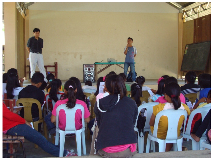
성경 암송 점검

특별히 이번에 새롭게 시작하는 토요 프로그램에서는 학생들이 모두 매주 두 구절의 성경을 같이 암송하고 있습니다. 저들의 기억 속에 선교사인 저희의 말이 남는 것보다는 하나님의 말씀이 저희들의 마음판에 새겨지기를 바라며, 네비게이트 60 구절 성경 암송 중에서 주제별로 1개씩을 선정하여 모두 30 구절을 암송하기 시작했습니다. 매주 누적해서 2, 4, 6,...의 구절을 짝을 지어 점검하며, 암송하게 하고, 최종적으로 모든 학생들 앞에서 완벽하게 암송을 하는 학생들에게는 매주 푸짐하게 시상을 하고 있습니다. 그리고 30 구절을 모두 완벽하게 암송하는 학생에게는 실질적으로 도움이 될 수 있는 '장학금'을 주겠다는 약속을 했습니다. 참여하는 학생들 모두가 성경 암송의 불이 붙었습니다. 더불어서 교장 선생님과 지도 교사도 같이 성경 암송에 참여하고 있는데 아쉽지만 많이 불안해 보입니다.