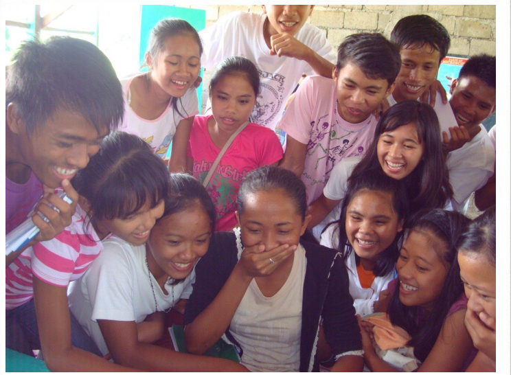
그동안 찍은 사진들을 보면서

그런데 문제는 토요일 프로그램입니다. 매월 한 번 드러지는 예배만으로는 학생들을 훈련하고 양육할 수가 없기 때문에, 지난 학기에는 자원하는 학생들 중에서 20명의 학생들을 선별하여 매주 토요일마다 별도의 프로그램을 진행하였습니다. 동기 부여를 위해서 한글도 가르치고, 영화도 같이 보고, 식사도 같이 해 먹으면서, 다양한 방법으로 주의 말씀을 나누는 일들을 해 왔었습니다. 감사하게도 이 일들을 통해서 학생들 개인은 하나님께서 자신들을 얼마나 귀하게 여기시는지를 깊이 깨닫는 귀한 체험들을 하게 되었습니다. 더불어서 저희들도 하나님께서 이곳까지 부르신 소명을 다시 한번 확인하는 귀한 계기가 되었습니다. 이런 유익으로 인하여 새로운 토요일 프로그램을 준비하면서 하나님께서 베풀어 주실 은혜로 시작 전부터 많은 설레임이 있었습니다.