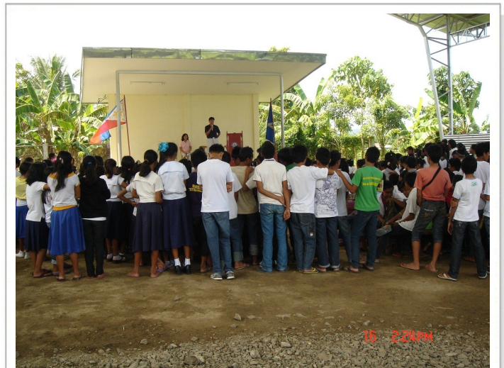
익핏 고등학교에 컴퓨터와 백과사전 기증

그런데 같은 조사 자료에 의하면, 흥미롭게도 필리핀은 세계에서 가장 많은 '문자 메시지 (SMS)'를 주고 받는 나라로 되어 있습니다. 약 7,000만명의 이용자가 하루에 10억개 이상의 문자 메시지를 사용한다고 합니다. 즉, 아직 환경이 구축되어 있지 않은 인터넷을 통한 Email이나 전화 음성 통화 보다는 저렴한 단말기 (핸드폰)를 통하여 수없이 문자를 주고 받고 있습니다. 이곳에 살고있는 저희로서는 얼마나 실감이 되는 내용인지 모르겠습니다. 저 역시 이곳에서 핸드폰이 없어서는 안될 정도로 긴요하게 사용을 하고 있지만, 음성 통화보다는 대부분 문자 메시지를 주고 받는 용도로 사용하고 있습니다. 100페소 ($2.50), 300페소, 500페소등의 통신 카드를 필요에 따라 전화기에 충전을 해서 사용을 하고 있습니다. 음성 통화로는 터무니 없이 적은 금액이지만, 문자 메시지용으로는 제법 오랜동안 여유있게 사용할 수 있습니다. 초기에는 이러한 문자 메시지 소통이 많이 불편 했지만, 지금은 (운전중에도 문자 메시지를 확인 할 수 있을 정도로) 아주 익숙해져서 도리어 편리하게 사용을 잘 하고 있습니다.