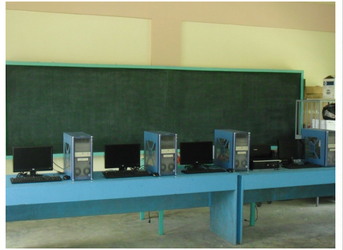
새롭게 단장한 마띠 고등학교 컴퓨터실

그런데 이러한 문자 메시지를 주고, 받으면서 가장 고민이 되는 부분은 모든 용건을 마친후 마무리하는 '마지막 인사'입니다. 음성 통화도 아니고, E-mail도 아니고, 너무 형식적 이지도 않고, 또한 너무 가볍지 않으면서도 좋은 '마지막 인사'가 무엇일까 하는 것을 문자 메시지를 보낼 때마다 생각 하게 되었습니다. 'Good Bye', 'Bye', 'Talk later', 'See you later', 'Blessings', 'Serving together', '^_^'.... 상황에 따라 모두 좋은 인사가 될 수 있겠지만, 선교사로서 이곳에 와 있는 저로서는 이 문자 메시지 또한 현지인들을 향한 하나님의 축복의 통로가 되는 것이 좋겠다는 생각이 들었습니다. 이렇게 해서 하나님을 믿는 자이든지 아니든지 주고 받은 문자 내용에 상관없이 마지막 인사는 이 땅 끝이 주님 앞으로 돌아 오기를 기도하는 마음과 함께 'God bless you!'로 하나님의 축복을 선포하고 있습니다.