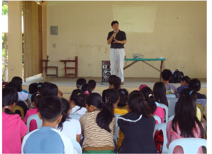
성경 암송이 주는 7가지 유익을 나누며

참여한 학생들의 많은 긍정적인 변화를 보면서, 학교측에서도 많은 관심 속에 새롭게 시작하는 토요일 프로그램을 위해서 새로운 학생을 모집하는 일들을 도와 주었습니다. 토요 프로그램 지원 마감일에 맞추어 교장 선생님께서부터 연락이 왔습니다. 기존에 참여했던 20명 전원은 물론이고, 새로운 140명의 학생이 추가되어 모두 '160명'이 토요 프로그램에 지원을 했다고 합니다. 얼마나 감사한지 모르겠습니다. 하지만 토요 프로그램은 대중을 상대로 하는 것이 아니라, 주님 안에서 친밀한 교제를 통하여 양육하고, 훈련하는 프로그램이기 때문에 160명이나 되는 많은 학생은 도저히 감당할 수 없는 저희 능력 밖의 인원입니다. 매우 아쉽지만 기드온이 32,000명 중에서 300 용사를 고르는 심정으로 여러 가지 조건을 추가하여 기존의 20명을 포함하여 최종 60명으로 선별을 하였습니다. 그러나 사실 60명도 저희가 감당하기에는 매우 힘겨운 인원이 될 것입니다. 왜냐하면 지난 학기에 20명의 학생을 양육하고 섬기는데도 저희에게 주어진 모든 것을 동원하여 힘에 부칠 정도로 최선을 다해야 했기 때문입니다. 그러나 그 수고의 기쁨이 얼마나 큰지를 잘 알기 때문에 저희가 감당할 수 인원보다 훨씬 더 많은 학생들을 품고 새학기를 시작하게 되었습니다